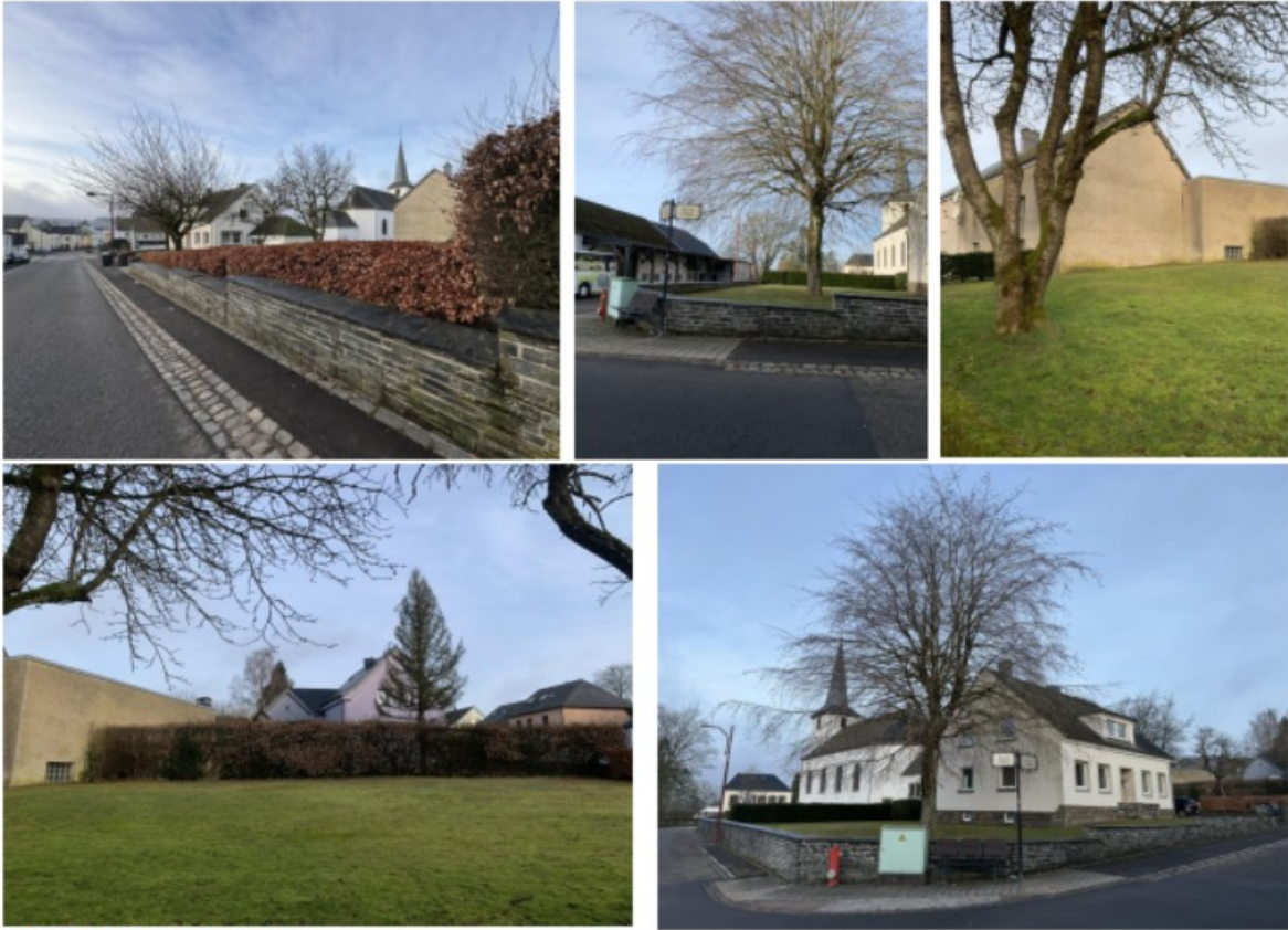
PRISES DE VUE GENERALE