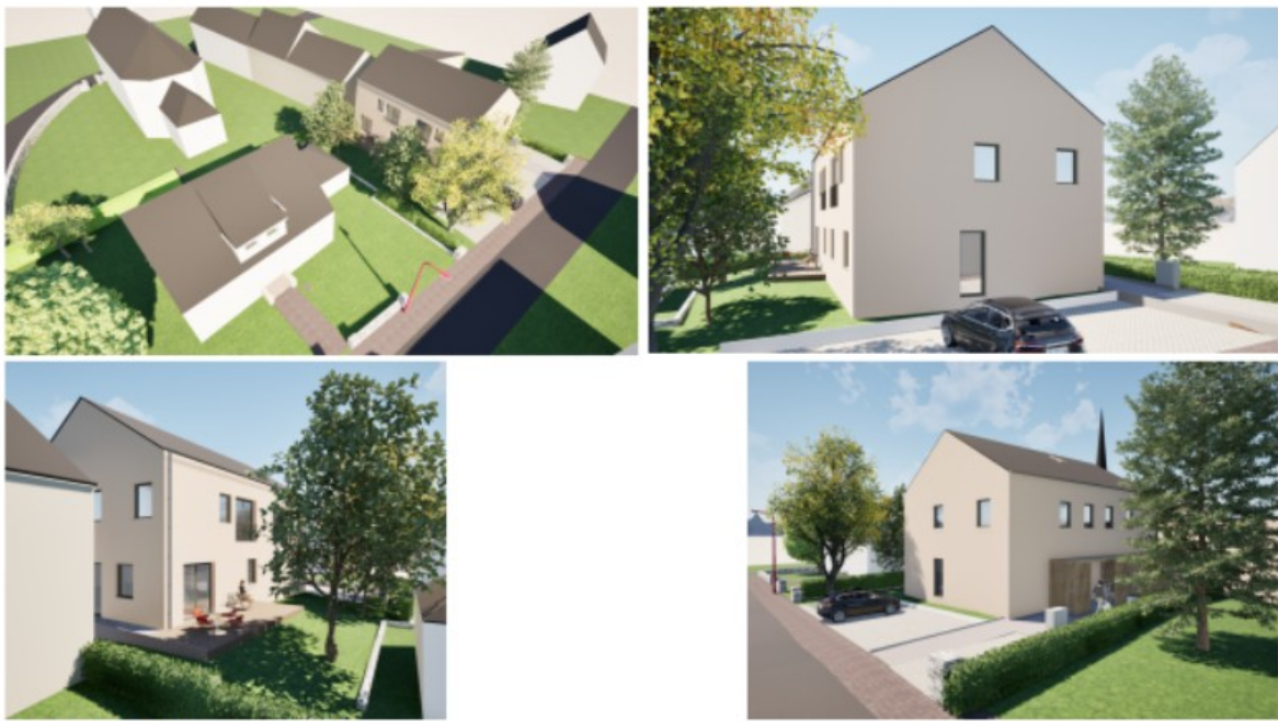
SITUATION PROJETEE - vues 3D